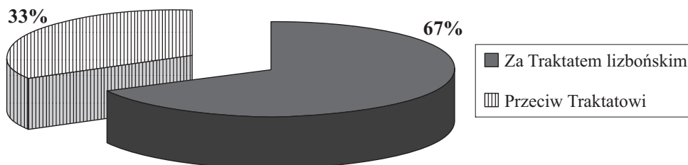
Wykres 2. Wyniki głosowania w sprawie Traktatu lizbońskiego w Irlandii w dniu 2 października 2009 roku